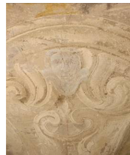
Particolare della decorazione pittorica murale in volta dopo l'intervento di descialbo e a fine lavori.

Il restauro conservativo interessa le decorazioni pittoriche murali dell'abside della Chiesa di San Pietro Apostolo in San Pietro in Cerro.