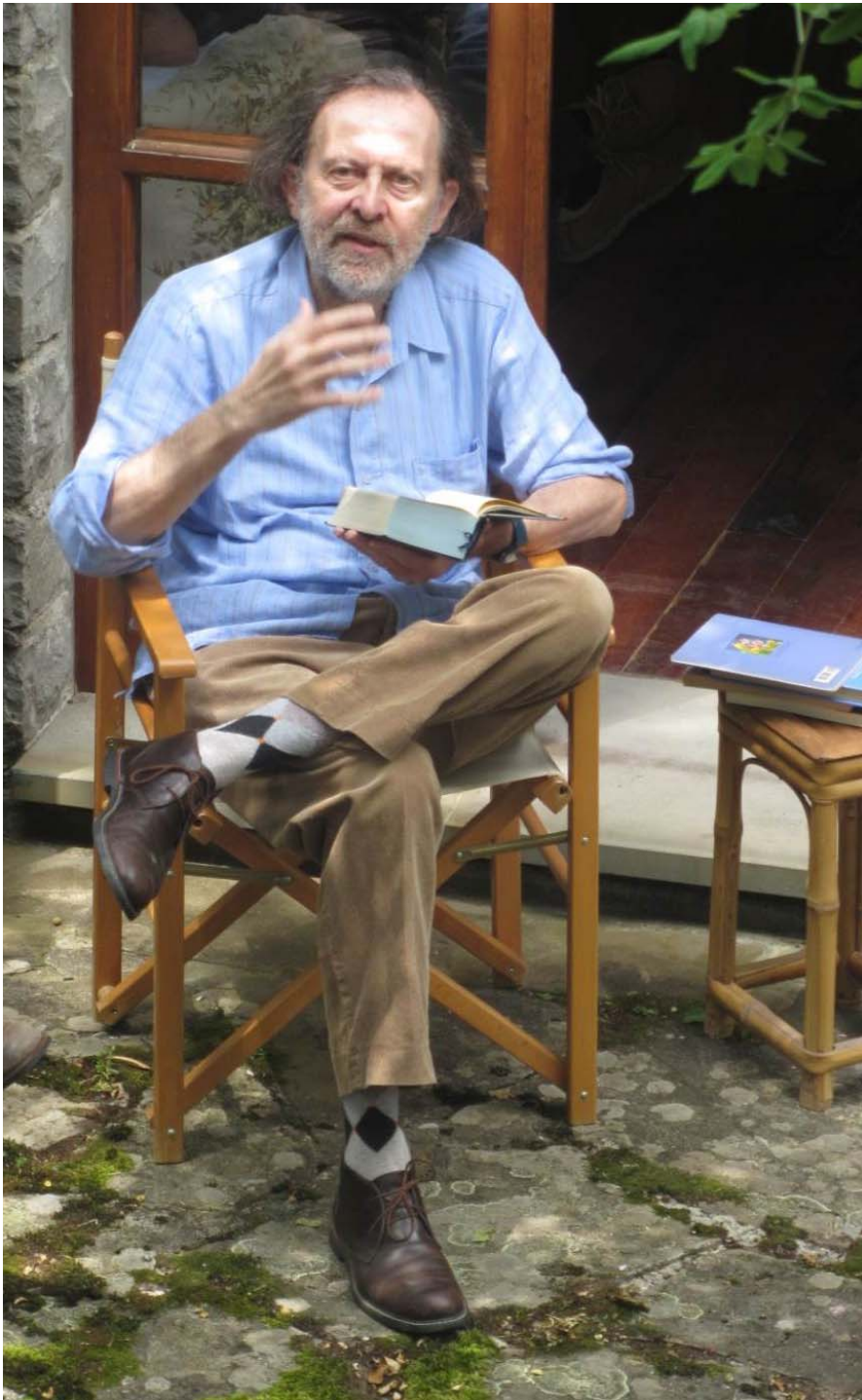
paolo lagazzi critico letterario e scrittore