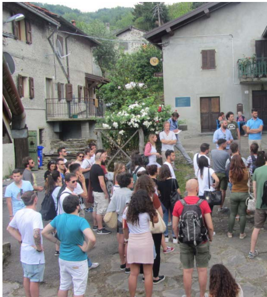
sopralluogo letterario casa bertolucci area di progetto