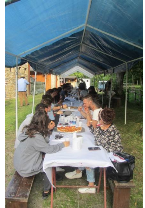
centro culturale le ciliegie