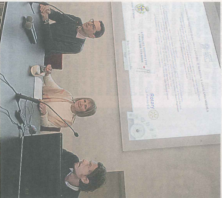
AFFRESCHI RITROVATI La presentazione del link che permetterà di ammirare gli affreschi del Palazzo ducale.